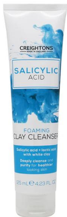
128.640 FOAMING CLAY CLEANSER Καθαριστικός Αφρός Προσώπου Με Σαλικυλικό Οξύ και Λευκό Άργιλο. SIZE: 125ml