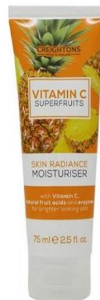
128.632 SKIN RADIANCE MOISTURISER Ενυδατική Κρέμα Λάμψης με Βιταμίνη C, Οξέα Φρούτων και Ένζυμα. Ενισχύει τη φυσική λάμψη του δέρματος. SIZE: 75ml