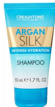
128.005 SHAMPOO SIZE: 50ML