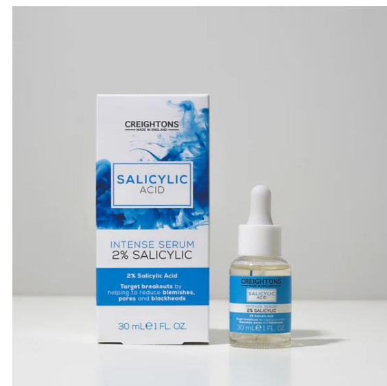
128.643 INTENSE SERUM Ορός Προσώπου Με 2% Σαλικυλικό Οξύ. Μείωση της εμφάνισης μαύρων σιγμάτων, κηλίδων και πόρων. SIZE: 30ml