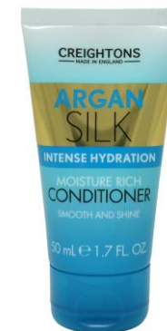
128.006 CONDITIONER SIZE: 50ML