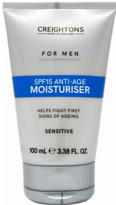
128.400 SPF15 ANTI AGE MOISTURIZER Size: 100ml