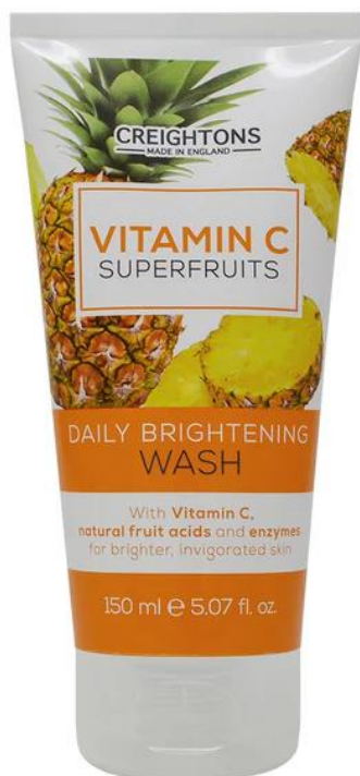
128.630 DAILY BRIGHTENING WASH Καθαριστικό Προσώπου Με Βιταμίνη C, Οξέα Φρούτων και Ένζυμα. Ενισχύει τη φυσική λάμψη. SIZE: 150ml