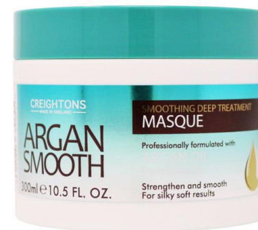
128.007 DEEP TREATMENT MASQUE Strengthens and nourishes hair for silky soft, smooth results. SIZE: 300ML UOM: 6