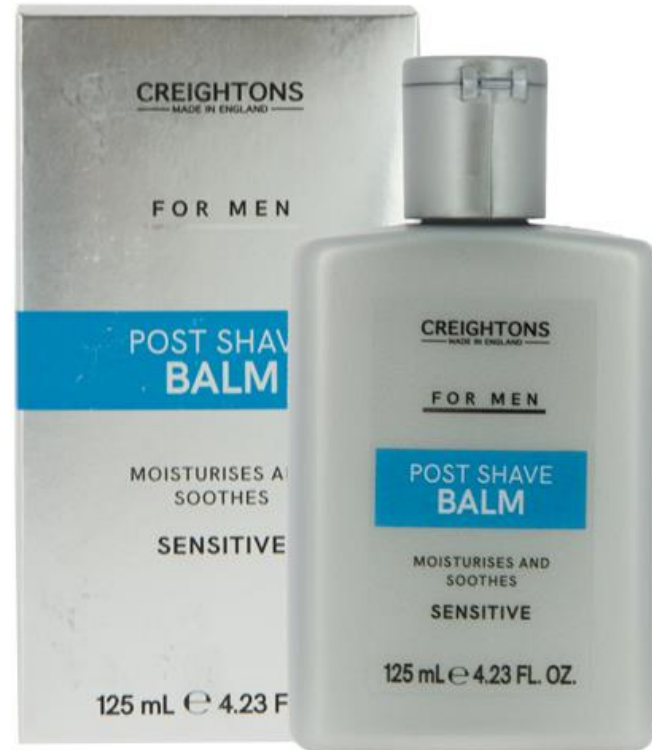
128.401 AFTER SHAVE POST SHAVE BALM Size: 125ml