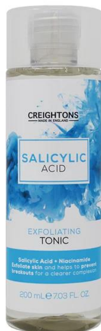
128.641 EXFOLIATING TONIC Τονωτικό Απολέπισης Προσώπου Με Σαλικυλικό Οξύ και Νιασιναμίδη. SIZE: 200ml