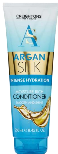
128.001 MOISTURE RICH CONDITIONER Creamy rich conditioner that nourishes and repairs the hair, leaving it shiny, healthy and manageable SIZE: 250ML UOM: 6