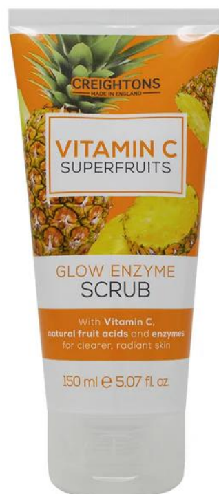
128.631 GLOW ENZYME SCRUB Απολεπιστικό Scrub με Βιταμίνη C, Οξέα Φρούτων και Ένζυμα για αποτελεσματικό καθαρισμό και απολέπιση. SIZE: 150ml