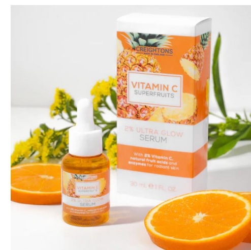
128.633 HYDRATE & GLOW SERUM Ορός Για Ενυδάτωση Και Λάμψη Με 2% Βιταμίνη C, Οξέα Φρούτων και Ένζυμα, για Λαμπερή Επιδερμίδα. SIZE: 30ml