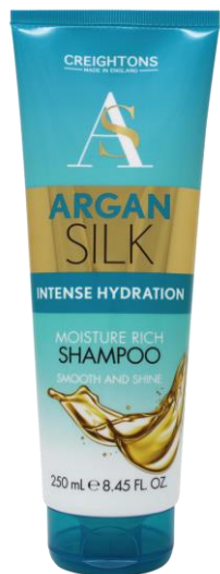
128.000 MOISTURE RICH SHAMPOO Deeply moisturising and shine enhancing shampoo for perfectly healthy hair. SIZE: 250ML UOM: 6